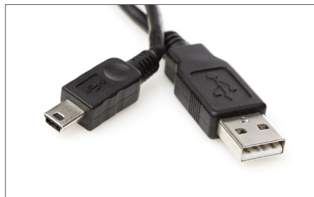
Safescan USB Kabele Art. nr: 112-0459