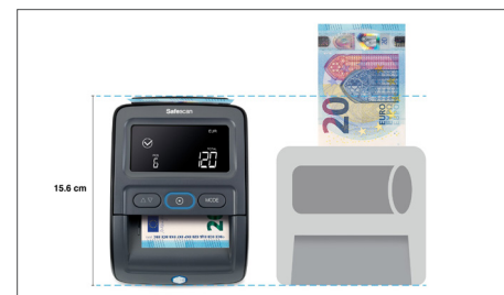
Heeft een van de kleinst beschikbare footprints in vergelijking met andere oplossingen in de markt