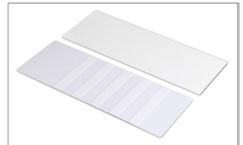
Safescan Cleaning Cards Art. nr: 136-0545