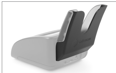
Safescan RS-100 Banknote Stacker Art. nr: 112-0695