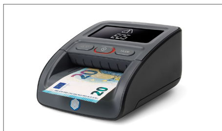
Controleert bankbiljetten op tot wel zeven echtheidskenmerken