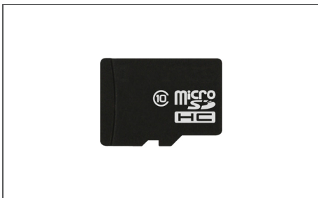
Safescan MicroSD Kaart Art. Nr: Diverse (afhankelijk van apparaat en valuta)