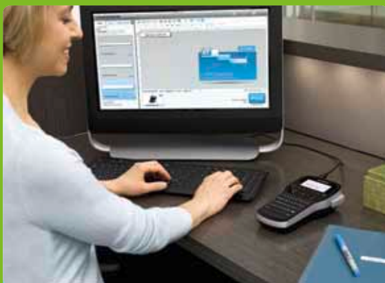
Op uw bureau